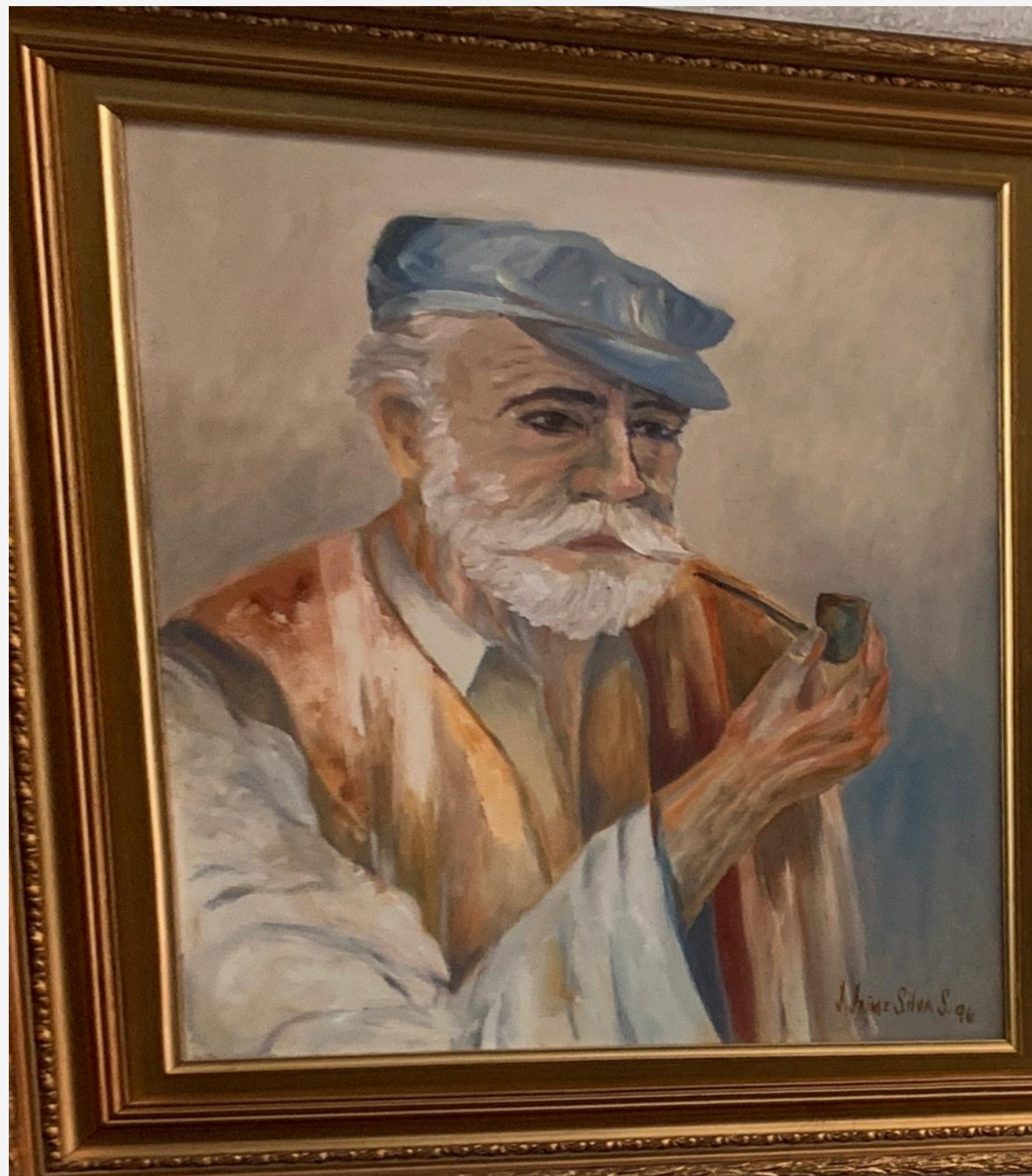
Retrato 70 X 90 cm Óleo sobre lienzo