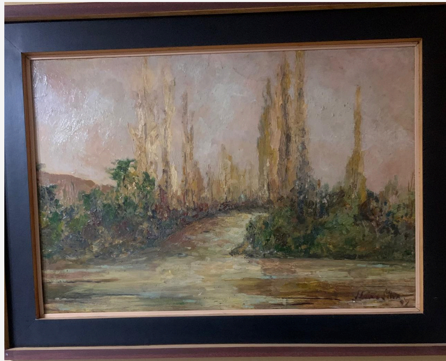
Arboleda 70 x 60 Óleo sobre madera