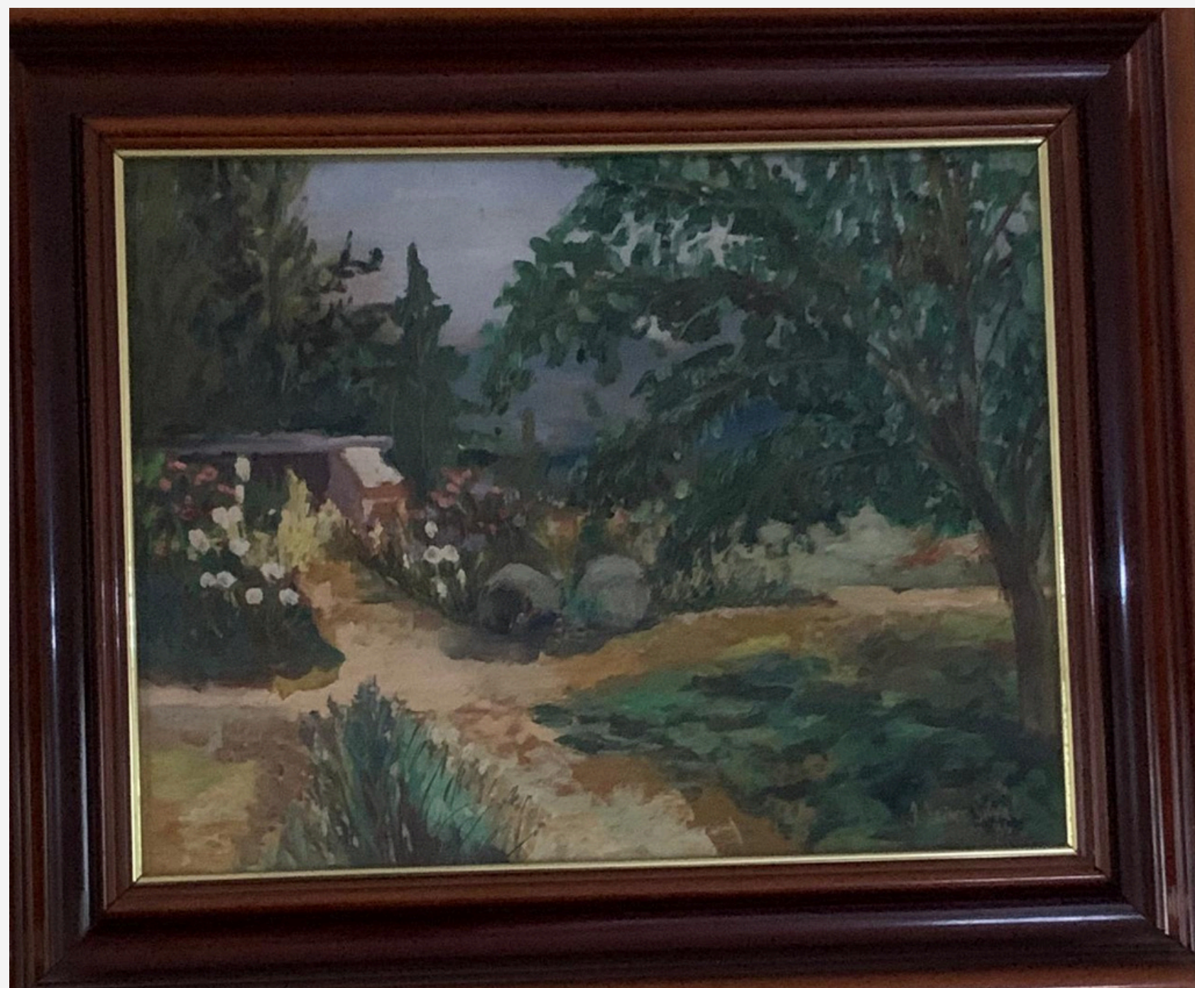
Jardines 40 x 50 Óleo sobre madera